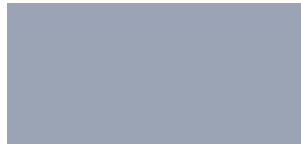
Bleu Polaire H8H8