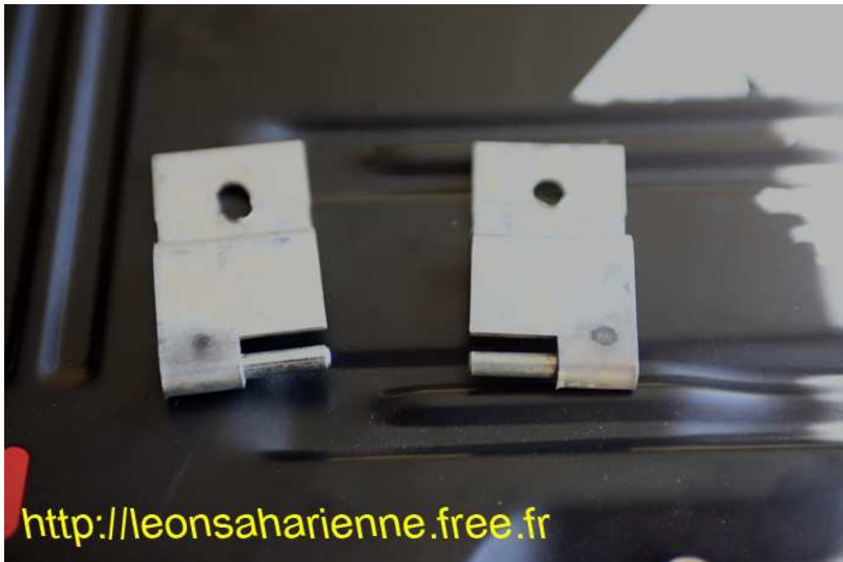
Demi charnière Réf. : 1J9 802 815 B / 1J9 802 816 B Ajusté les trous pour réglé le couvercle