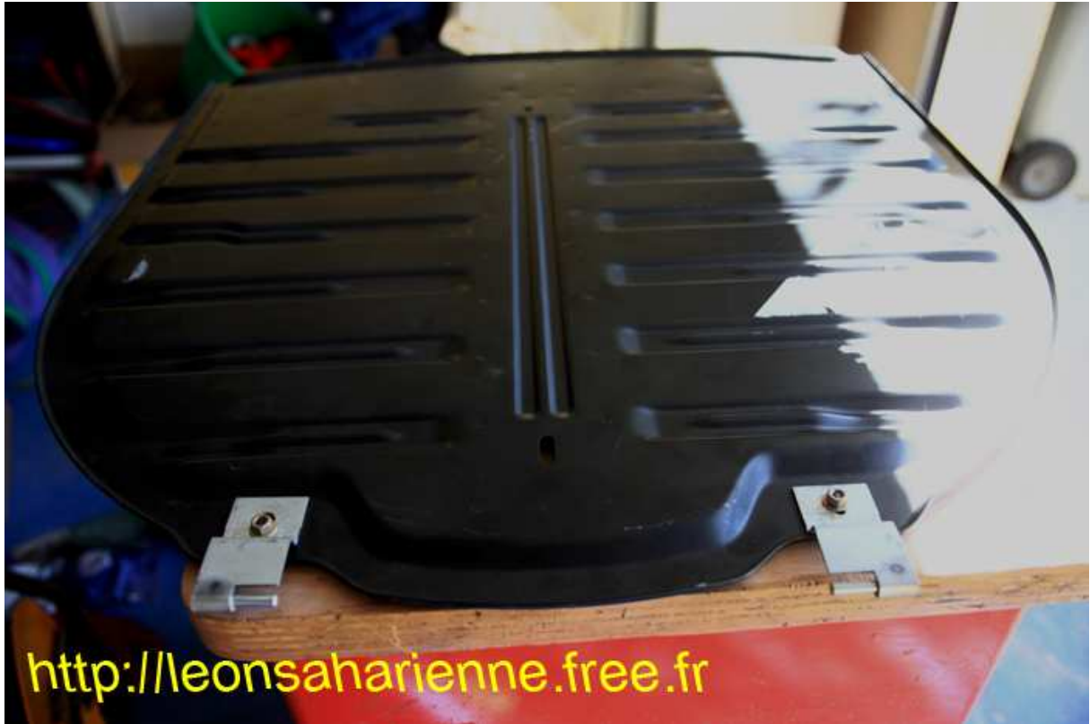
2 Demi-charnières avec les 2 boulons 8mn