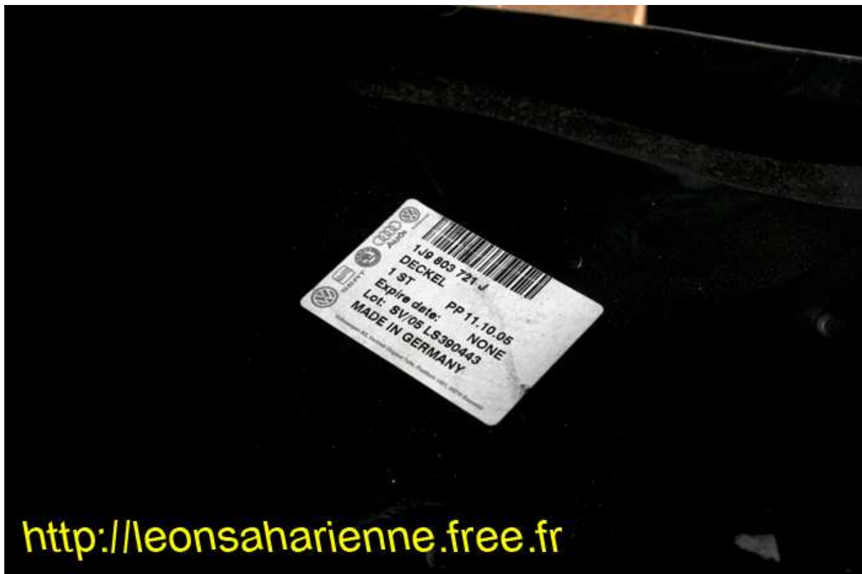
Couvercle pour compartiment de la roue de secours Réf. : 1J9 803 721 J 3 réf. : 1J9 803 721 J traction av. / 1J9 803 721 G 4x4 / 1J9 803 721 M 4x4 6cyl.