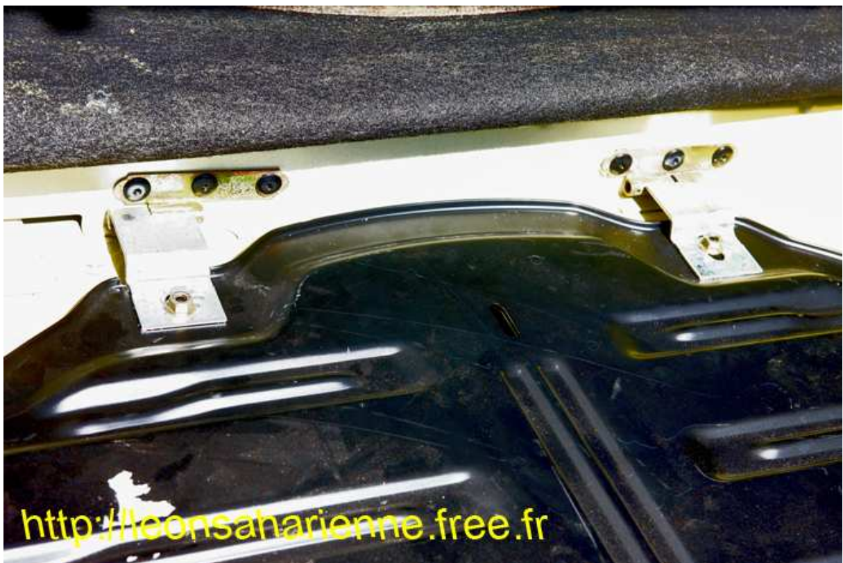
Les 2 autres Demi-charnières avec les rivets